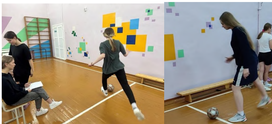
Этап «Футбол» (10 ударов по малым воротам без касания пола)