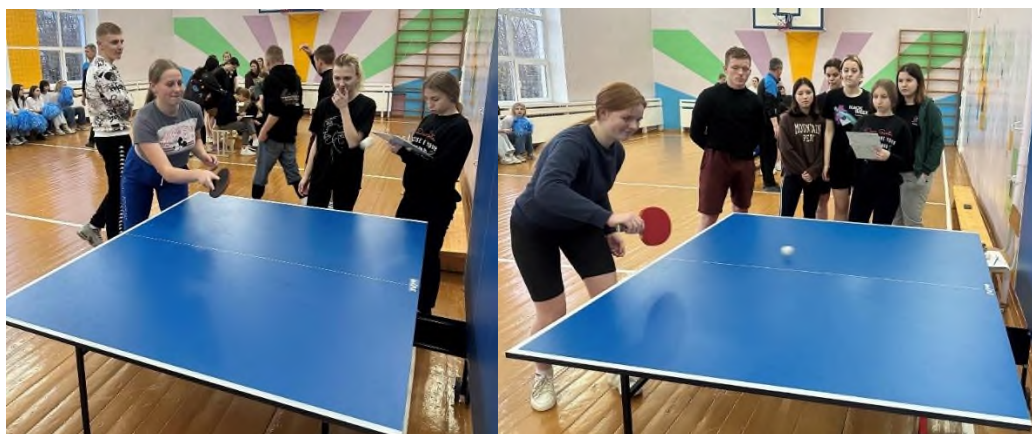
Этап «Настольный теннис»

(отбивание и прием мяча от вертикальной и горизонтальной поверхности теннисного стола)