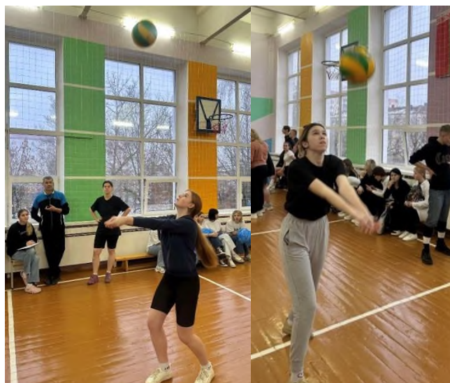
Этап «Волейбол» (Верхний и нижний прием мяча за 30 секунд)