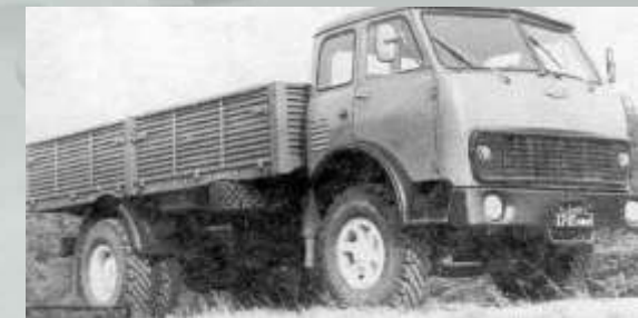
МАЗ - 5335