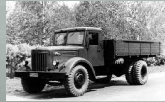
МАЗ - 200