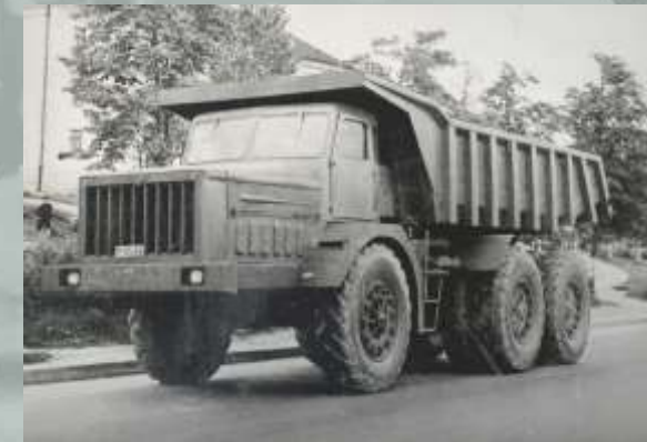
МАЗ - 530